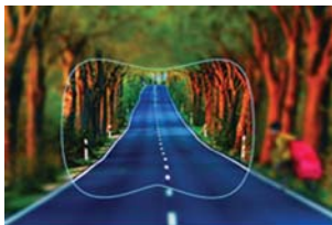
Поле зрения в спортивных очках с обычными Rx линзами

Спортивные FreeForm линзы дают пользователю спортивными очками высокую остроту зрения, отличное бинокулярное зрение, широкие поля периферического зрения.