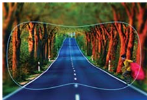
Поле зрения в спортивных очках с FreeForm Rx линзами